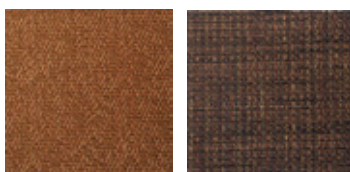
27 X 28 U